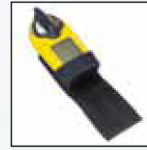
Чехол для крепления на ремне