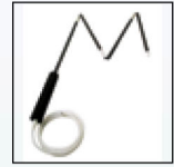
Разборный датчик отбора проб

Для получения полного списка принадлежностей обращайтесь в компанию BW Technologies.