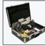
Комплект для работ в закрытых зонах