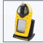
Встроенный насос и зарядное устройство батарей